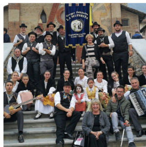
Gruppo Folcloristico La Muffrina Camporgiano