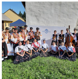
Gruppo Folcloristico Podpol'Anec Detva