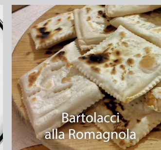
Bartolacci alla Romagnola