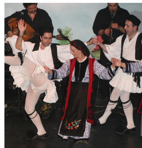
Gruppo Folcloristico DIAVLOS Tessaglia