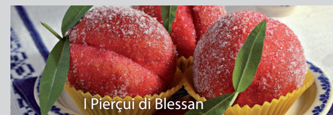
Pierçui di Blesan