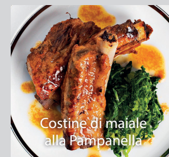
Costine di maiale alla Pampanella

Anche quest'anno la cucina di "DANZANDO TRA I POPOLI" vi propone un assaggio di presidi Slow Food e piatti tipici della nostra regione e della tradizione delle regioni ospiti.