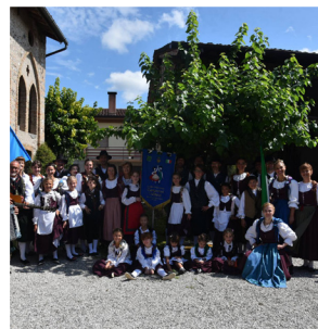
Gruppo Folcloristico Danzerini Udinesi Blesano di Basiliano